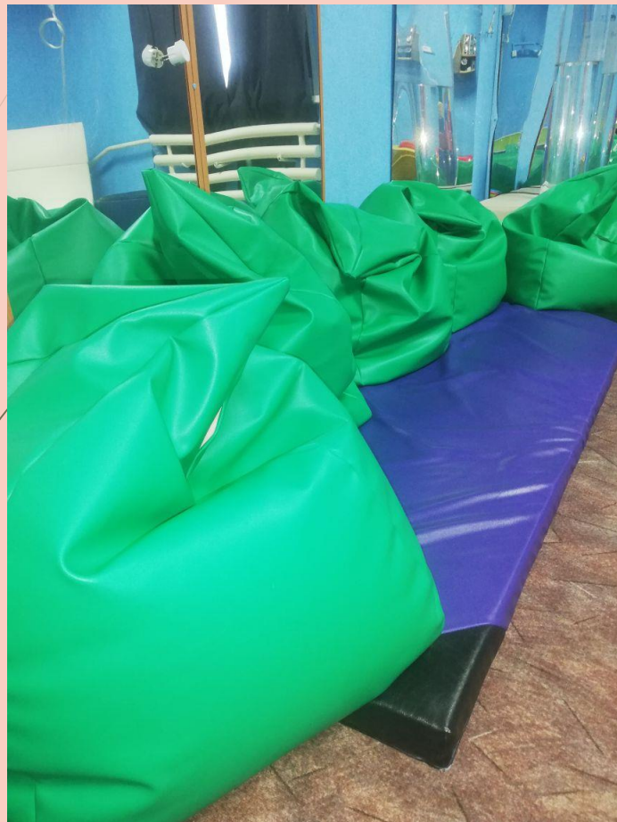
Пуфик-кресло с гранулами

Оборудование, приобретенное на средства Фонда поддержки детей, находящихся в трудной жизненной ситуации для реализации проекта "Дорога к миру"